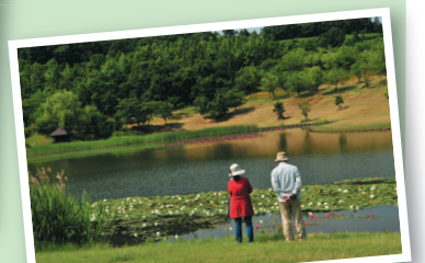
新潟県立植物園 野外園地