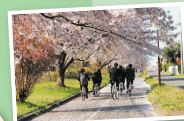
サイクリングロード(蒲ヶ沢)