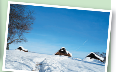
古津八幡山 冬景色